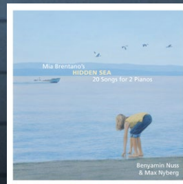
Mons Records (CD) • Ries & Erler (Sheet Music)

On the annual “Want List” of Fanfare Magazine